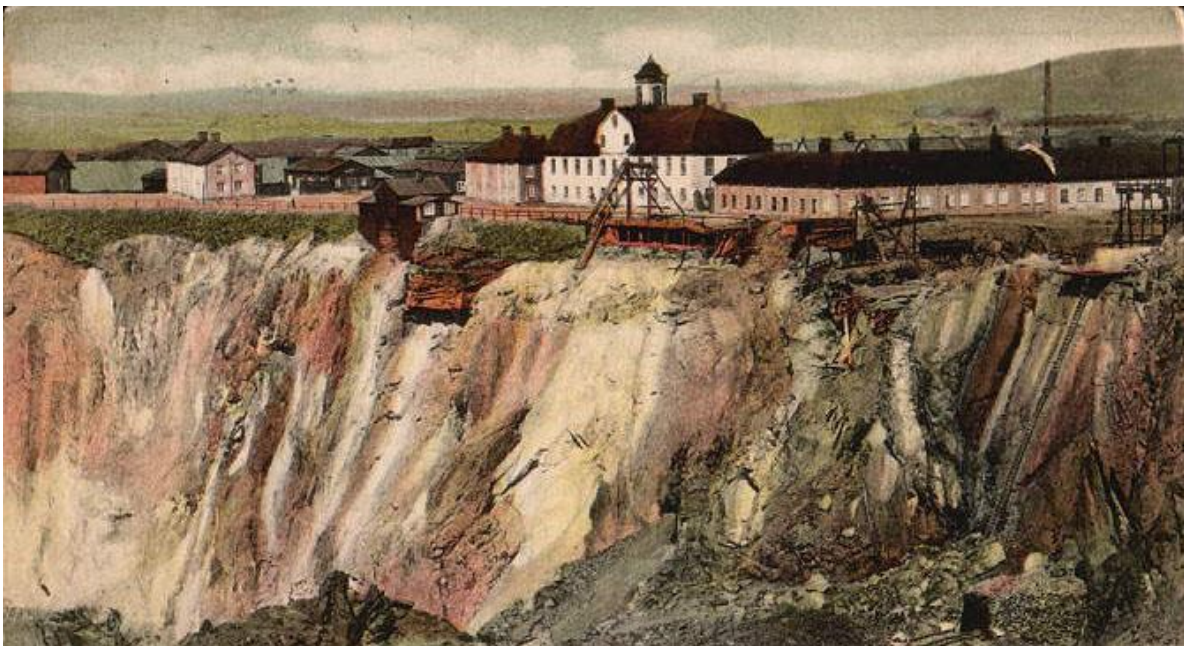
Falu Gruva på 40-talet