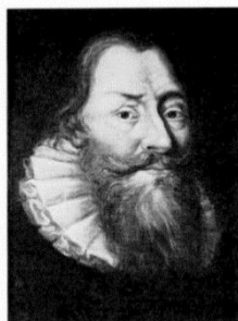
LAURENTIUS PAULINUS GOTHUS Målning (beskuren) av okänd konstnär.

Hade klubben funnits idag, hade den välkände historieprofessorn Dick Harrison helt visst fått besöka den för ett antal bejublade framträdanden.