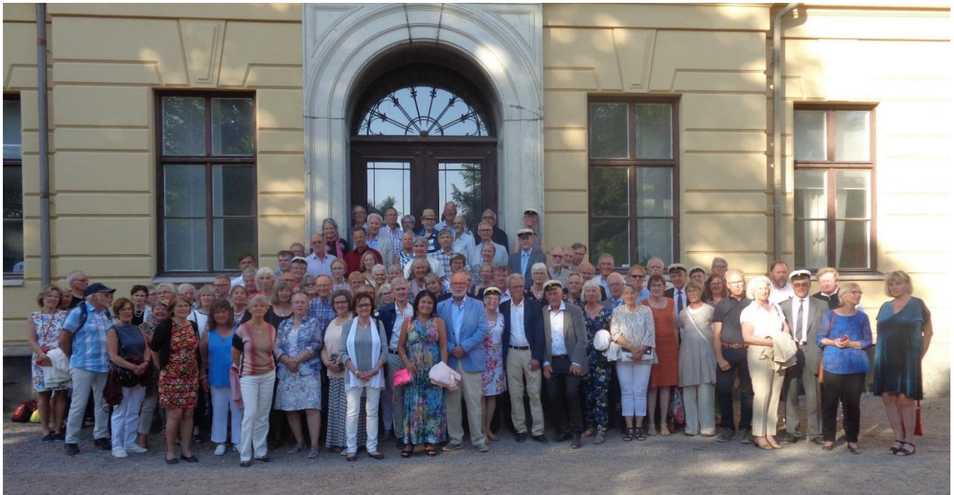
Text och foto: Per Gilén

Eftersitsen fortsatte hos Åke Wänn i gamla Elsborgskyrkan på Hyttgatan 28, mitt emot OKQ8. På småtimmarna släntrade så ett antal glada och trötta 65-plussare hemåt i den ljumma vårnatten. Till skillnad från för 15 år sedan då vi klafsade hem i 10 cm blötsnö, som ramlat ner under kvällen.