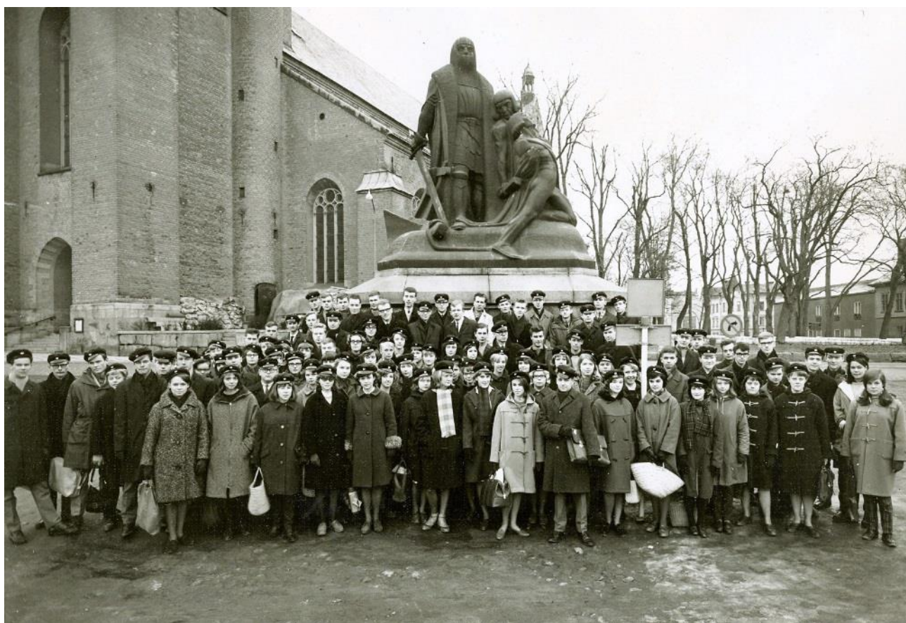
Framför Engelbrekt inför studentskrivningarna 1964